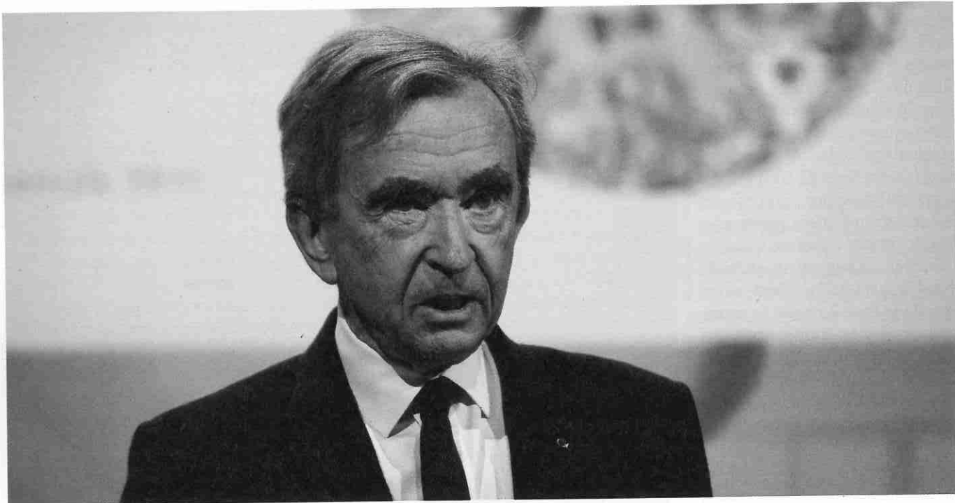
Bernard Arnault, le 17 avril 2025. Le 20 septembre dernier, le PDG du groupe LVMH a remis en cause les compétences universitaires de Gabriel Zucman, l'accusant de vouloir « mettre à terre l'économie française ».

réparti entre les fondateurs, les salariés et une pléthora d'investisseurs institutionnels.