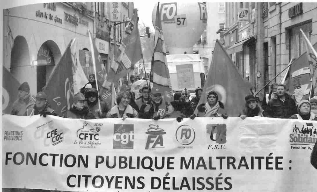
Manifestation pour la défense du service public, le 22 mars 2018 à Metz