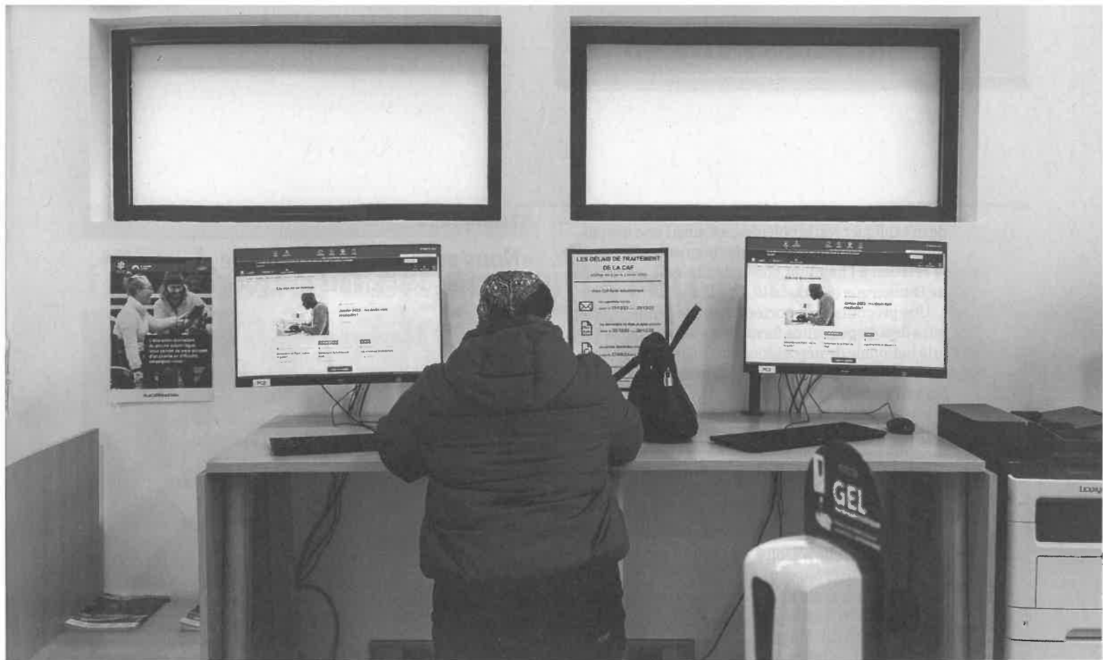
Les usagers qui ne parviennent pas à s'adapter à la numérisation des démarches administratives finissent par s'adresser aux mairies, notamment.

un ensemble flou appelé "les acteurs de proximité", centres sociaux, centres communaux d'action sociale [CCAS], mairies et associations, qui voient arriver à leurs portes l'ensemble des refoulés des administrations du social, tous ceux qui n'arrivent pas à s'ajuster au nouveau fonctionnement, à la numérisation et à la prise de rendez-vous en ligne, ces nouveaux filtres mis en place avant de pouvoir rencontrer un agent